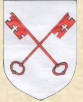
Altra Arma Civati